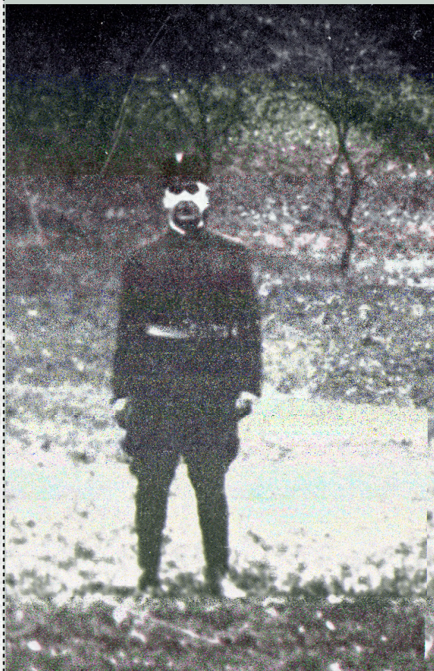
Bogdan Krizman, Pavelić i ustaše, Zagreb 1978, str. 128