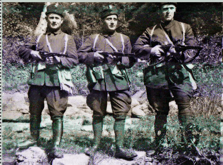
Arhiv Jugoslavije, 14 – 27 – 72