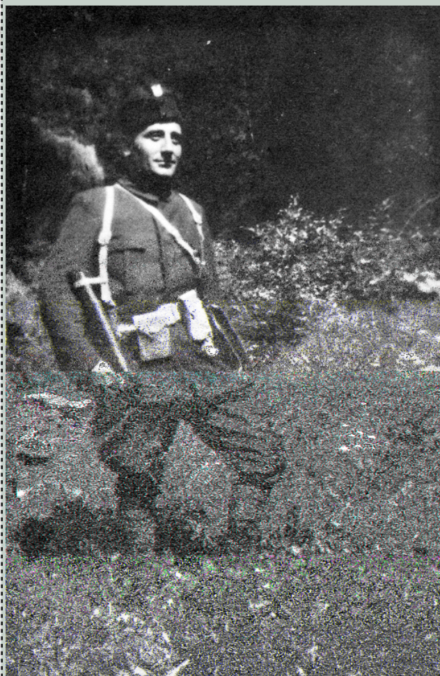
A A č D K ( Č ) I š